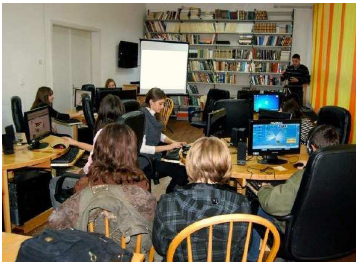
Uczniowie „Szkoły Dziennikarstwa” w Bibliotece Publicznej Zavidovići, Bośnia i Hercegowina

Wśród partnerów są: Gmina Zavidovići, Agencja Zatrudnienia, szkoły oraz Agencja Demokracji Lokalnej. Wszystkie te podmioty były zaangażowane w marketing i promocję projektu oraz dostarczały pomysłów i udzielały wsparcia przy organizowaniu wykładów i warsztatów. W przypadku niektórych działań Gmina udzieliła również wsparcia finansowego.