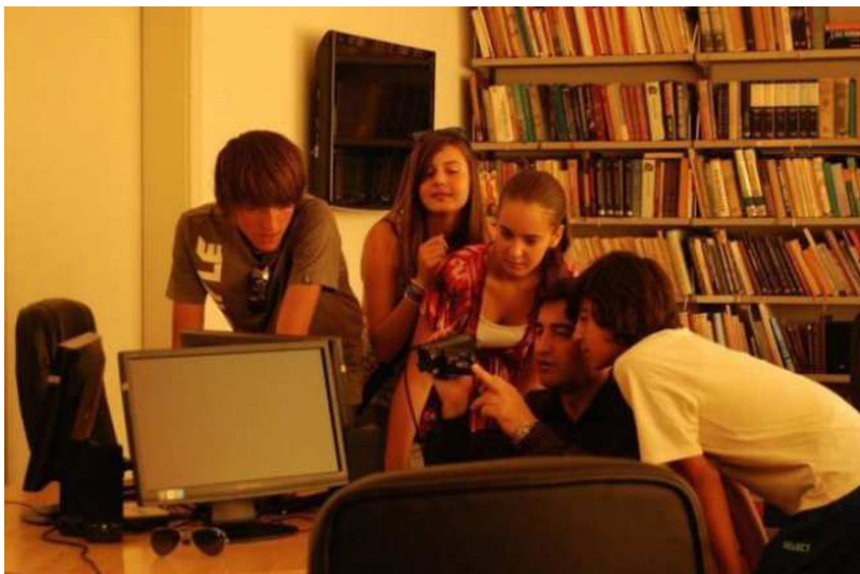
Biblioteka Publiczna Zavidovići stworzyła centrum multimedialne dla 'pokolenia sieci'. Ci młodzi ludzie nakręcili film promujący ich miasto.