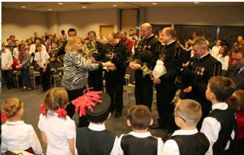
Barbórka w Galerii