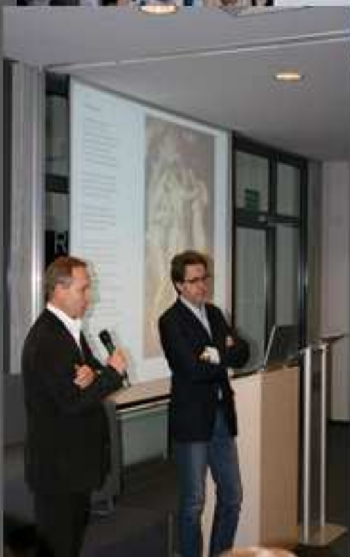
Demontaż Literatury. Trzy kwadransy o tekstach