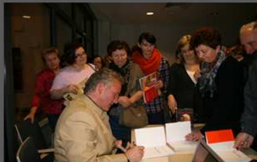
Spotkanie autorów z Jarosławem Krettem