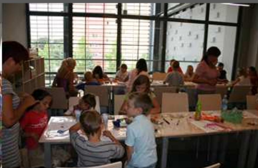
Kolorowo i wesoło