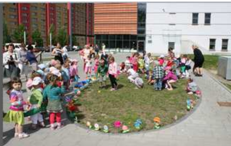
Kwiaty dla mamy