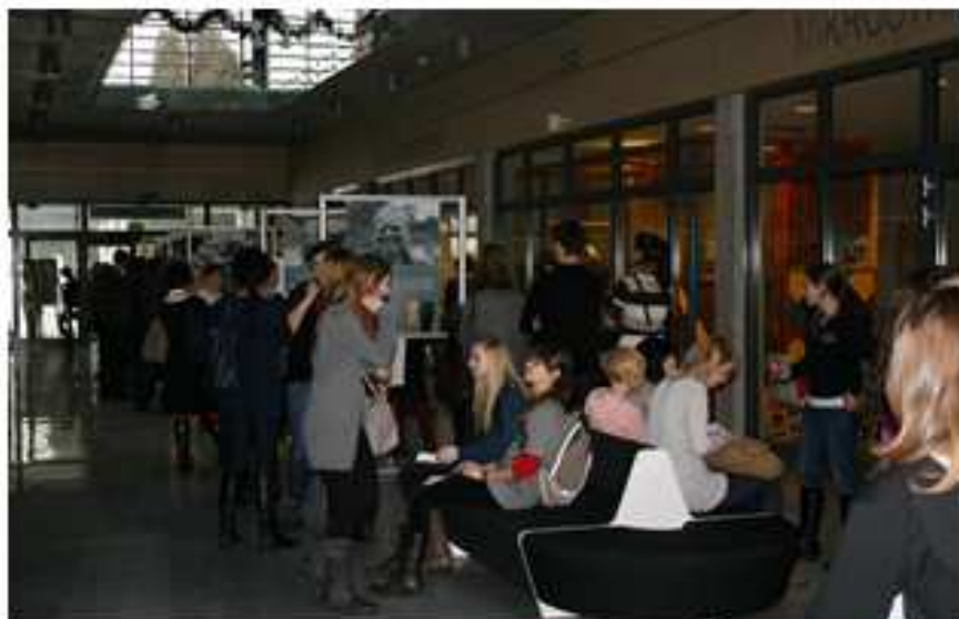
Mitosz po amerykańsku - Wystawa