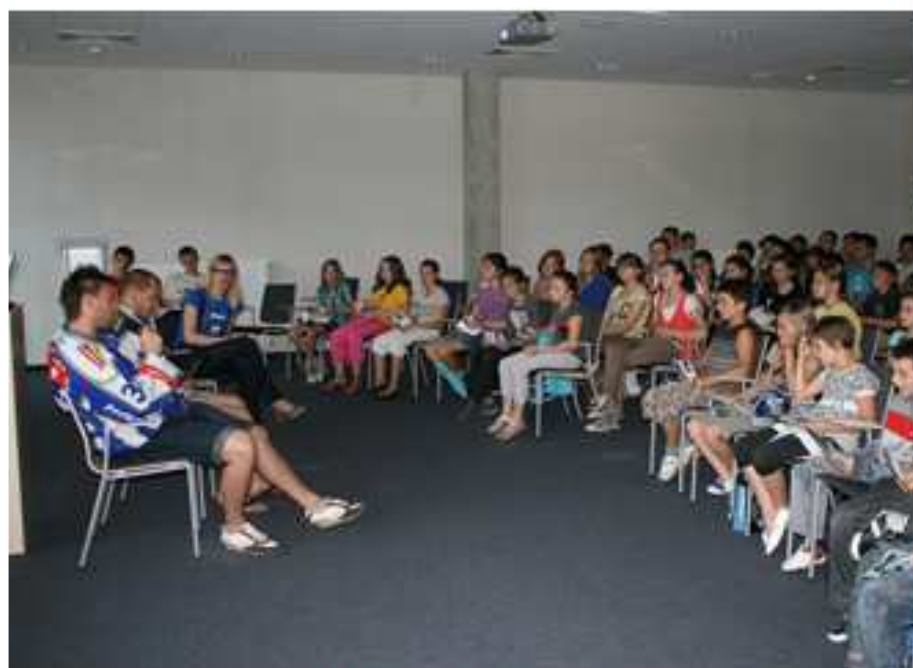
Majowy F estiwal In spiracji – Kibicujemy książce