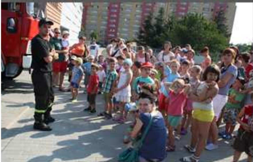
Mamo, ja bym chcia być strażakiem