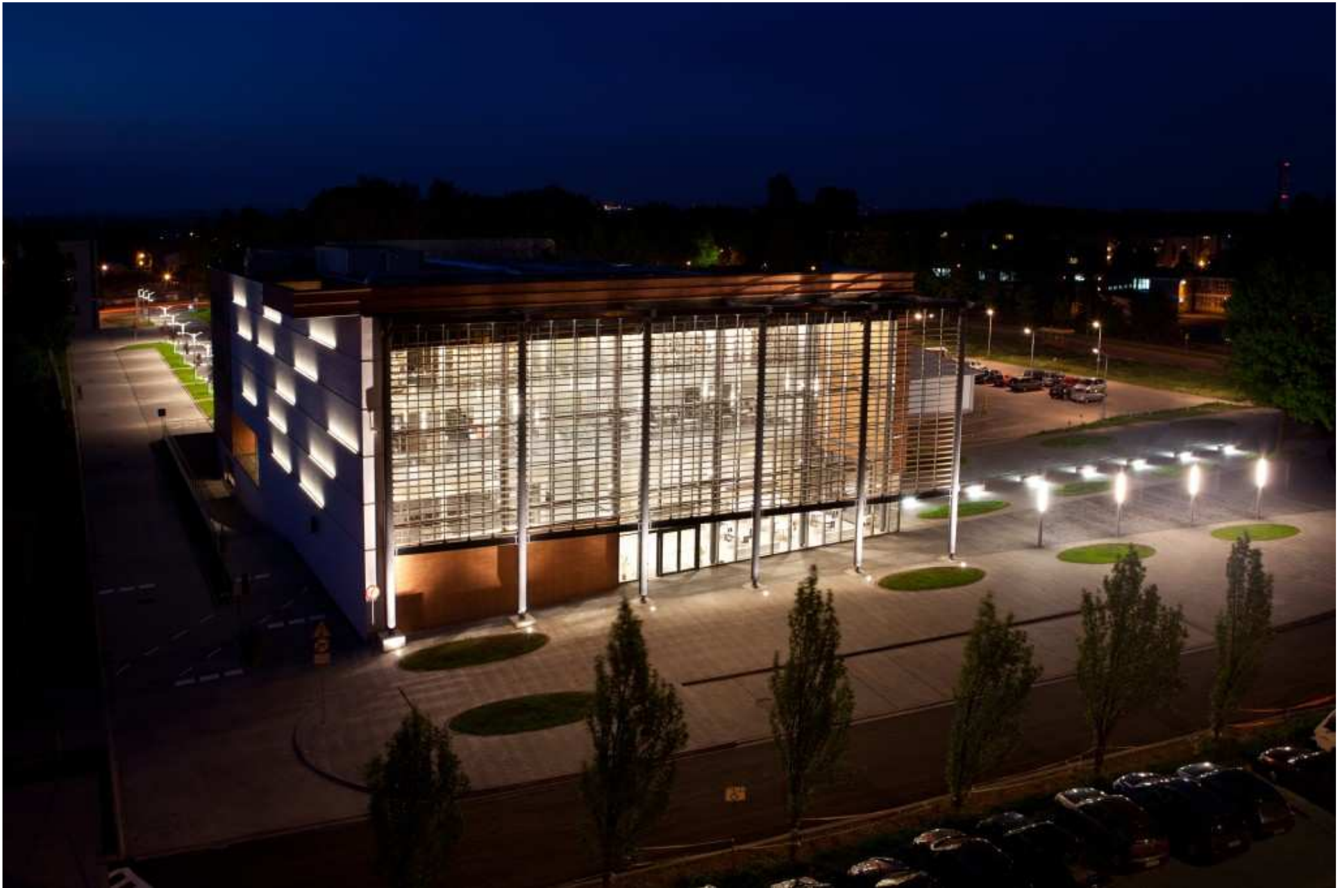
oświęcimska biblioteka z wizją