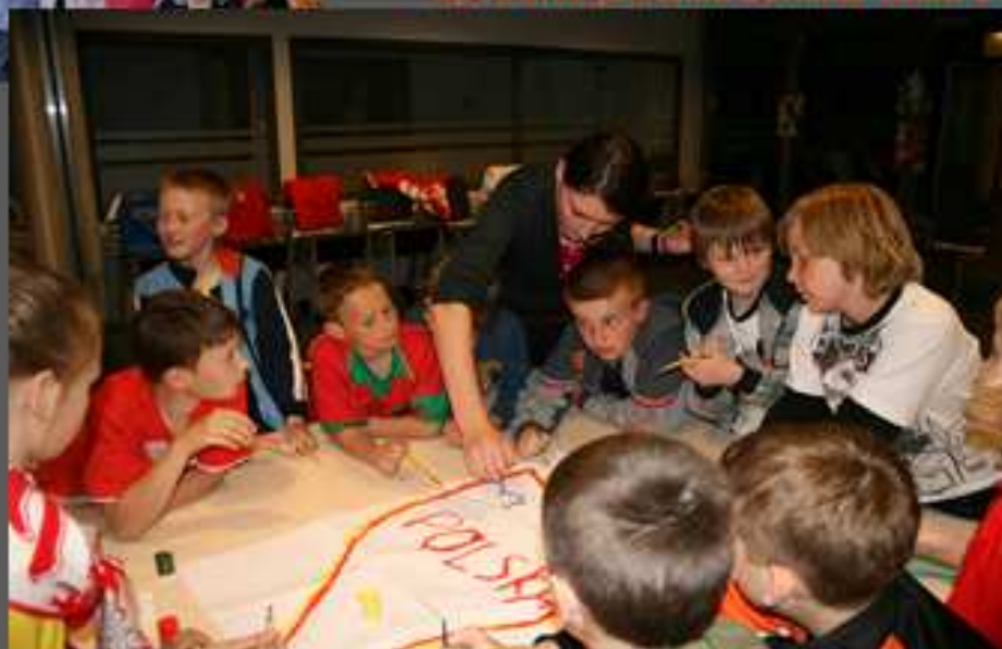
Hoc z piłką nożną