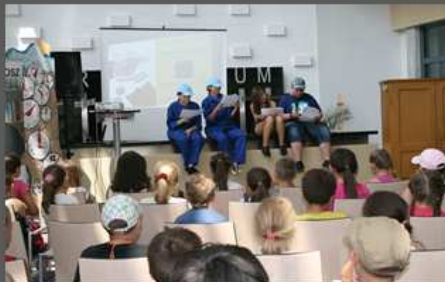
Happening volkacyjny - Tajemnicza scifa