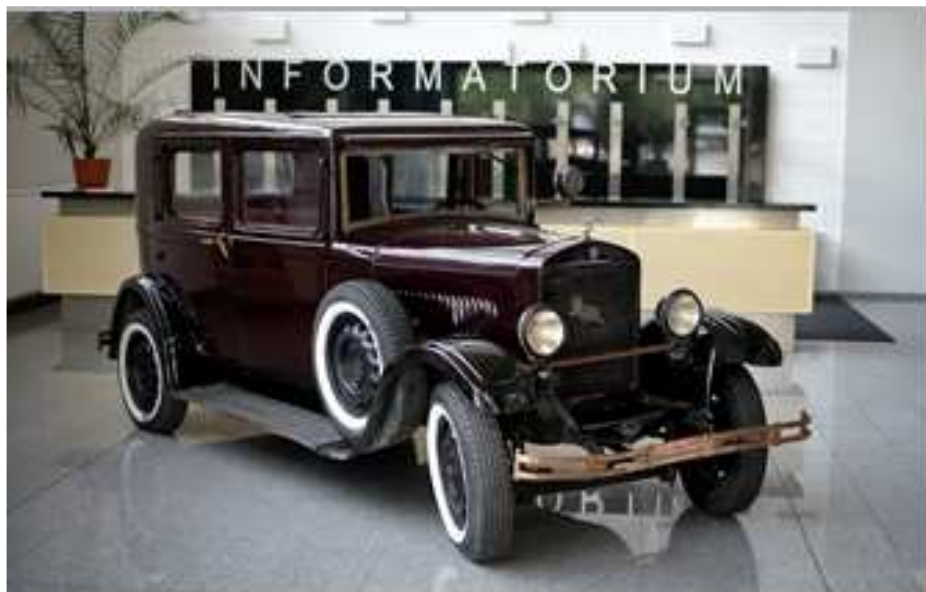
Przeżył skrzyń O świętym burmistrzu Mayda - Wystawa