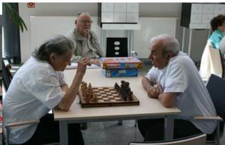
Majowy Festiwal Inspiracji – Kibicujemy książce