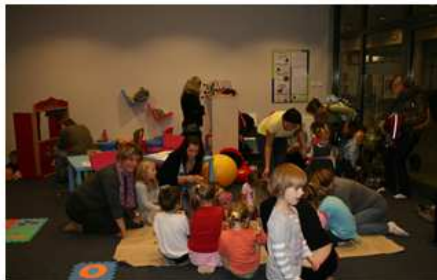
Miejsce dla wszystkich