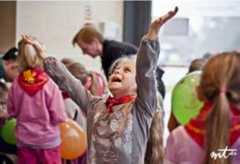
Ogólnopolska Nagroda Literacka im. Kornela Makuszyńskiego