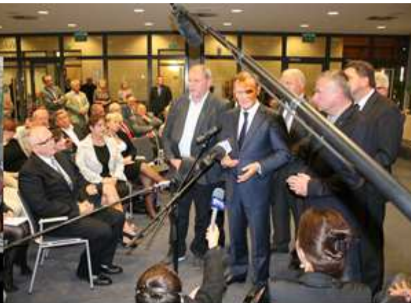
Spotkanie premiera Donalda Tuska z samorządowcami