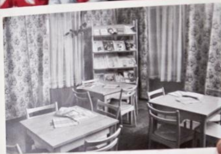
To jest czytelnia. Myślę, pamiętam.