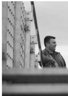
Edgore posthuma & kalendariusz wydana w 2008 r. w ramach...

Godzinny zarządek biura: poniedziałek - piątek 8:30 - 18:30 KRS 000026197 NIP 523-10-07-953 KBO01: 002177620