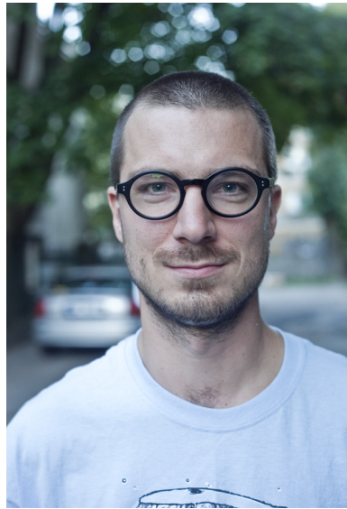
Plan bliski - zdjęcie poprawne