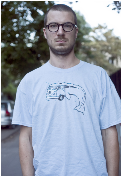
Błąd - postać „ucięta” w pasie; dłonie „obcięte” przy nadgarstkach