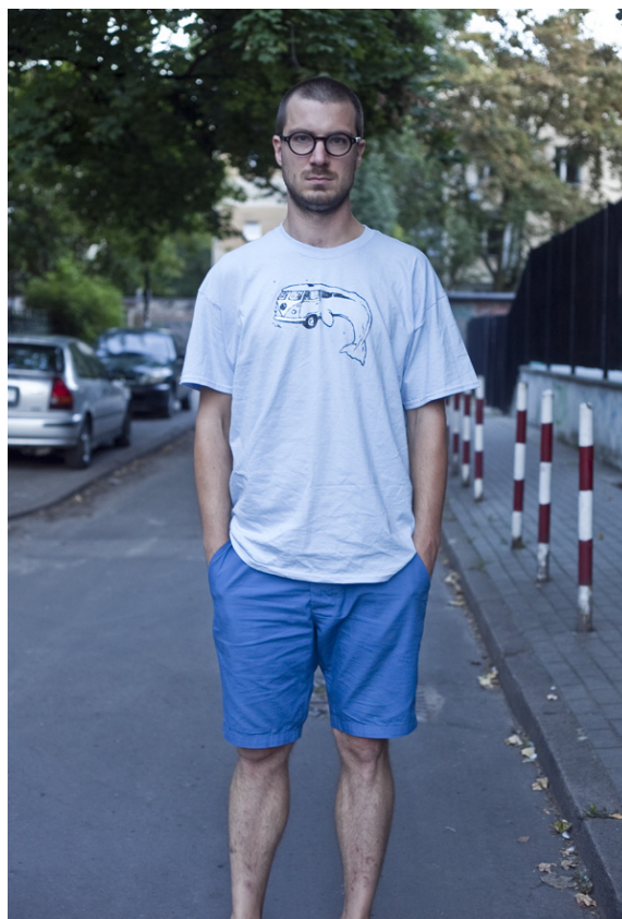
Błąd - stopy obcięte na wysokości kostek