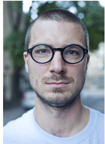
Błąd - głowa „wycięta” z kontekstu. Tak fotografuje się wyłącznie do dokumentów, a na takich zdjęciach, jak wiadomo nigdy nie wychodzi się dobrze...