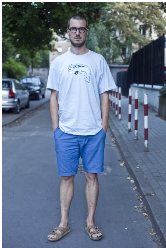
Plan pełny, poprawne zdjęcie