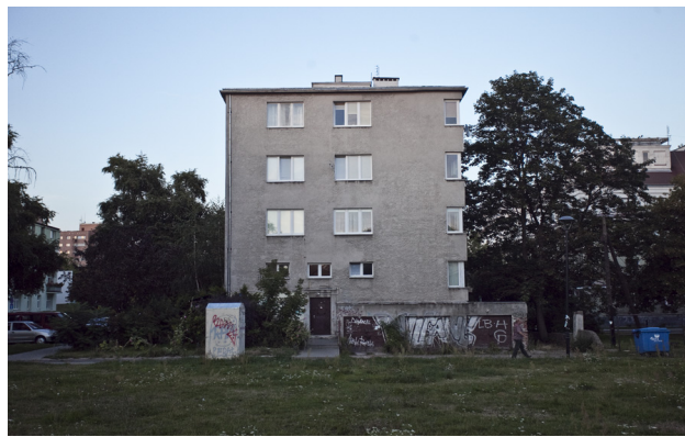
Jeśli tylko warunki na to pozwalają zdecydowanie lepiej jest odsunąć się nieco i przybliżyć budynek używając zooma.