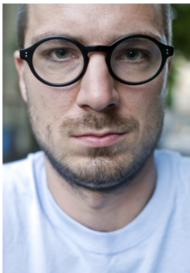
Przycięcie górnej części czoła nie jest błędem...