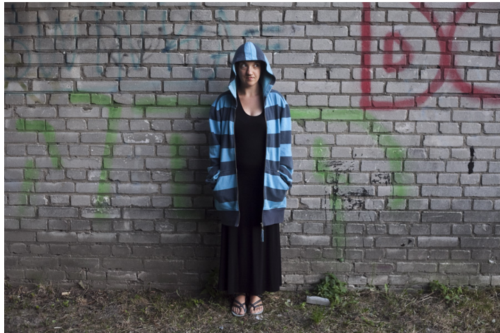
Kompozycja centralna często nie jest najlepszym wyjściem