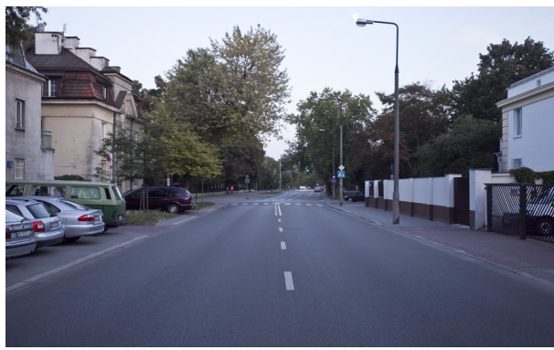
Horyzont w połowie - ulica zajmuje za dużo miejsca w kadrze, dolna część zdjęcia jest "za ciężka"