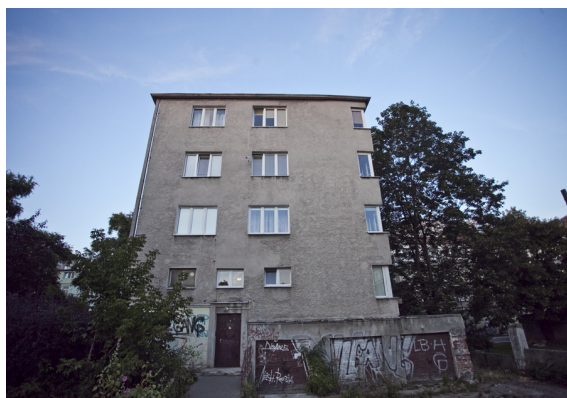
Błąd - budynek sfotografowany ze zbyt bliskiej odległości, aparat podniesiony do góry. W efekcie otrzymujemy nienaturalne skręty perspektyw.