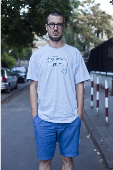
Plan amerykański, poprawne zdjęcie

11. Jeśli zdecydujesz się skadrować modela, staraj się nie „obcinać” jego ciała na wysokości stawów (kostki, kolana, biodra itp.). Przy bliższych kadrach nie bój się „ucinać” czubka głowy modela, jednak jeśli to robisz, zwróć uwagę by granica kadru przebiegała na wysokości jego czoła.