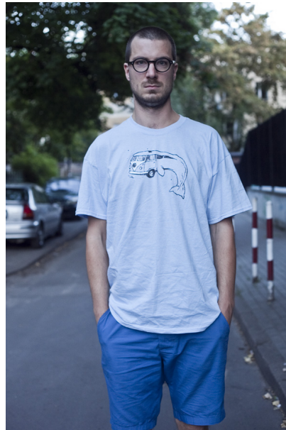
Błąd - kadr kończy się na wysokości kolan