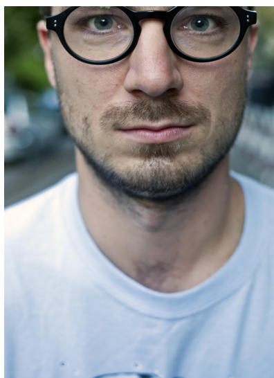
... ale trzeba zachować umiar - kadr powinien kończyć się raczej w połowie czoła.