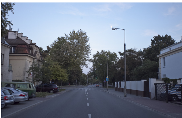
Zdjęcie poprawne - horyzont równoległy do górnej i dolnej granicy kadru