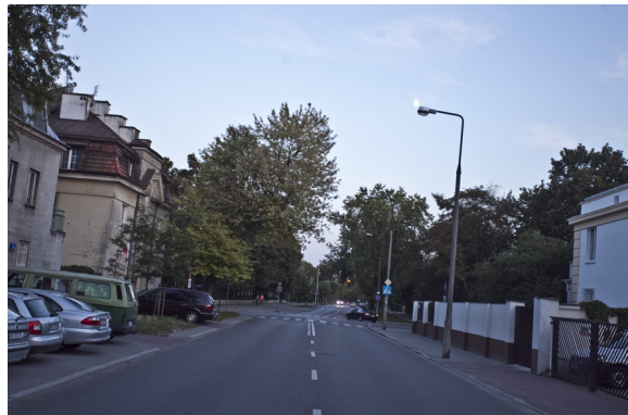
Błąd - krzywy horyzont