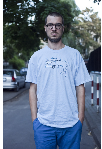
Dużo naturalniejszy efekt otrzymamy, gdy zamiast kadrować na wysokości kolan podniesiemy aparat odrobinę wyżej, kadrując na wysokości uda