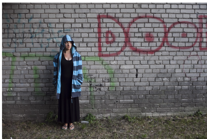
Lepszy efekt otrzymamy budując kompozycję w oparciu o mocne punkty. Głowa modelki znajduje się w jednym z mocnych punktów. Oglądając zdjęcie podążamy za jej wzrokiem.